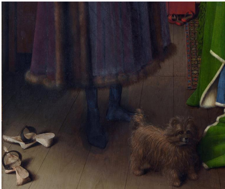
תמונה 3 (פריט מתוך תמונה 2)